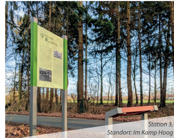
Station 3, Standort: Im Kamp Hoog

Ein Themenpfad auf politischen Spuren aus drei Jahrhunderten